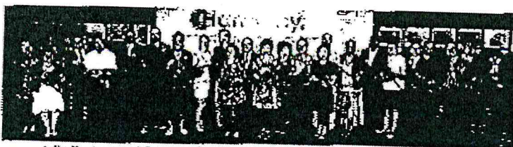
Adjudicators and Guests of Honour opening the exhibition of HKISAC 2015